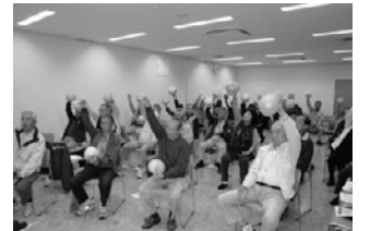
●ふれあい倶楽部 研修会 (高齢者福祉事業)

JA広島市旅行センターは、みなさまの旅行のアドバイザーとしてツアーからオリジナル旅行、チケット、宿泊の手配など、旅行に関する様々なお手伝いをしています。あそこに行きたい、団体で、ファミリーで・・・と“旅”をご計画のみなさまからのあらゆるご相談やお申し込みにも専門職員がお応えします。