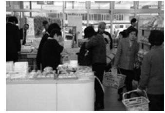
●コンビニ機能を備えた購買店舗

肥料・飼料・農薬・農業機械など農業をする上で必要な資材を提供し、農業のお手伝いをしています。また、生活に必要な米・燃料など組合員や地域のみなさまに必要な物資を提供し、暮らしのお手伝いをしています。