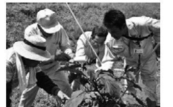
●現地での営農指導

介護・福祉・健康の総合相談窓口「ほっと館」。みなさんのことを「ほっとかんだよ」を合言葉に、さまざまなサービスを提供しています。ご本人やご家族の「困った時」に、生活や健康状態に合わせたアドバイスとサポートで、みなさまの暮らしを支援しています。