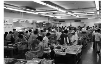
●農彩館五日市ファーマーズマーケット

組合員が生産する農産物を集荷し、市場やスーパー・量販店と連携しながら販売を行っています。