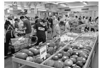
●農彩館 五日市 ファーマーズ マーケット

生産法人・大型農家・生産部会等との関係強化に努め、販売と連動した作付誘導を行っています。また、消費者へ安全で信頼される農産物を提供するため、栽培歴に適合した生産と、その栽培記録の記帳や農薬の安全使用の啓発に努めています。さらに「JA食農教育プラン」の実践を通じて、次の世代を担う子ども達の心身ともに健全な育成支援に努めるとともに、『食』と食を支える『農』への理解の促進を進めています。