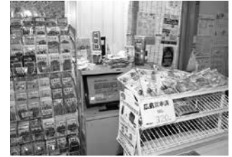
●地域・季節に合った品ぞろえ

肥料・飼料・農薬・農業機械など農業をするうえで必要な資材を提供し、農業のお手伝いをしています。また、生活に必要な米・燃料など組合員や地域みなさまに必要な物資を提供し、暮らしのお手伝いをしています。