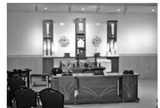
●小規模葬儀専用会館 「とのがホール」を会館

誰もがさけて通ることができない「葬儀」。万一のときに備え、JA広島市葬祭センターでは365日24時間体制をとっています。「安全・安心・安らぎ」のサービスの提供により、安らいだ気持ちで故人をお見送りできる葬儀を目指しています。また、葬儀専用会館として、「高取葬祭会館」「可部葬祭会館」「小河原葬祭会館」「安佐葬祭会館」「とのがホール」を運営しています。