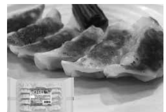
●広島菜の新たな食べ方を提案した 広島菜漬餃子

広島冬の味覚を代表する特産物「広島菜漬」。最大の広島菜栽培地である川内地区を中心としたJA広島市管内の農家により契約栽培された原菜をもとに、JA広島市広島菜漬センターにおいて丹念に漬け込みを行っています。毎年好評を得て、地元広島をはじめ全国各地への発送により、たくさんのご家庭でご賞味いただいています。また、広島菜漬直売所では、ギフト商品のほか必要な量に応じた量り売りも行っています。