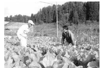
●18の地域における 「地域別農業振興プラン」の実践

レディースクラブ活動や健康管理活動を展開し、「地産地消運動」「食農教育プラン」への取り組みや生活習慣病予防健診等を実施しています。