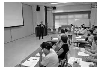
●レディースクラブトップ研修会で 自己改革について学習

農と住の調和したまちづくりの視点に立ち、組合員や地域みなさまの資産の保全管理、有効活用や、暮らし全般に関する悩み事など様々ご相談にお応えするため、専門の部署を設置し総合的にお手伝いをしています。また、組合員みなさまを対象とした税金セミナーなどで参加者に配布している『実りの人生ノート』は、「家族への愛のメッセージ」をテーマに本人の意思を綴る人生の覚え書きとして、多数の方にご活用いただいています。