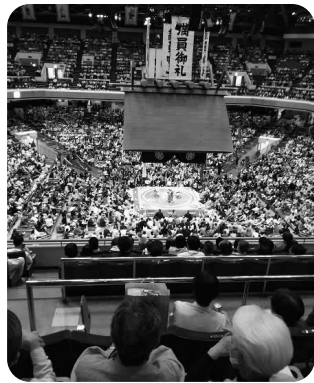
大相撲観戦は迫力満点！

新幹線でウキウキしながらの出発。窓から大きく美しい富士山が見えた時は、旅の幸先よしと思えました。スカイツリーでは天望デッキからの眺めに感動し、ガラス床に立ち、下が見えて足が震えました。楽しみにしていた国技館での大相撲観戦。織のにぎやかさに驚き、ワクワクしながら館内に入りました。2階椅子席からでも力士がぶつかり組み合う音まで聞こえ、迫力満点でした。2日目は旅のメインの日光東照宮参拝です。ガイドさんの案内で豪華な建物の厳かさや美しさに圧倒され続けました。彫刻などの由来やエピソードを聞きながらゆつくりの参拝。石段の上に砂が敷き詰められ、馬が走り抜ける流鏝馬の練習を見学。また輪王寺では、ご住職のお話しの後、僧侶の方の踊りも見学。どちらも翌日が祭りで練習されていたとのこと。とても嬉しい出会いでした。