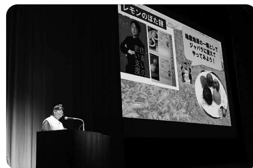
安佐支部 / 家の光記事活用体験発表