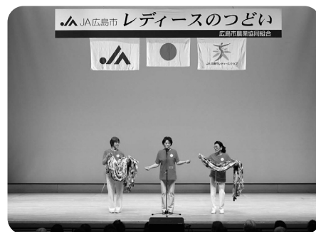
3,000羽の折り鶴を折りました！